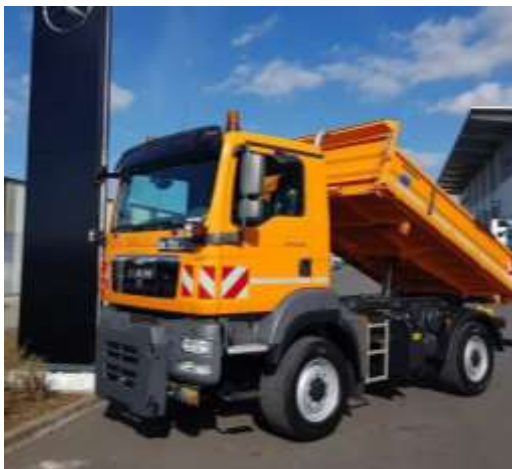
pokazna slika modela